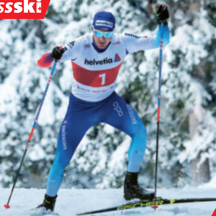
Dario Cologna Langlauf

Sporting Park engelberg freizeit . sport . event